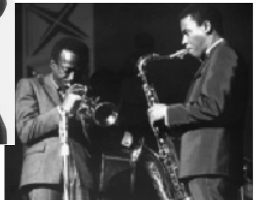
Miles Davis en Wayne Shorter