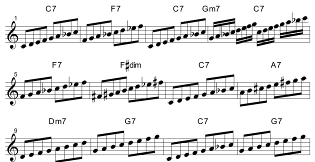
Figuur 3. Hetzelfde bebopschema, opgevuld met toonladders.