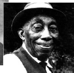
Mississippi John Hurt