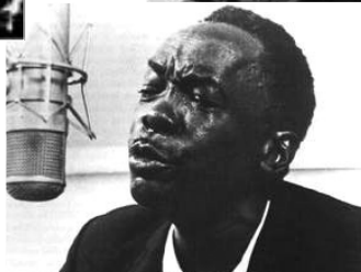
John Lee Hooker