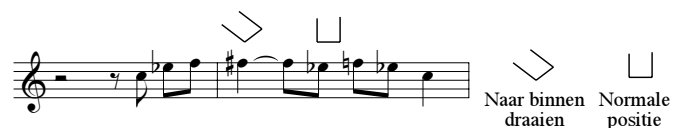
Figuur 7. 'Bending'.

Om een nog sterker 'blue' en 'weeklagend' effect te krijgen buigen bluesgitaristen vaak tonen af door de snaar iets opzij te trekken; in het Engels heet dit 'bending'. De hoogte van de toon wordt daardoor van een kwarttoon tot een halve toon veranderd, wat bijzonder klaaglijk klinkt. (Dezelfde techniek wordt in Indiase klassieke muziek door sitarspelers gebruikt om microtonale toonhoogtevariëaties te maken, 'shruti's'.) Op de fluit kun je iets soortgelijks doen door afhankelijk van het effect dat je wilt bereiken de fluit naar binnen of naar buiten te draaien terwijl je een toon speelt; zie figuur 7 en 8.