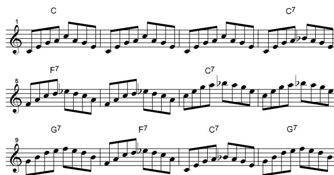
Figuur 3. Idem.