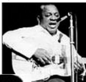
Big Joe Williams