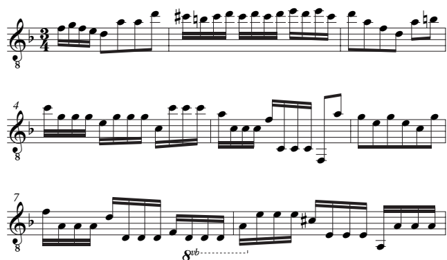
Voorbeeld 5a. Marais , couplet 32.