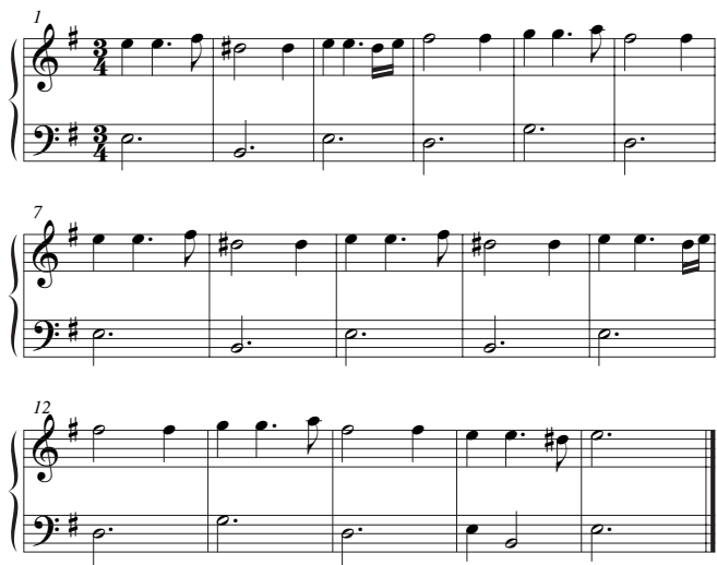
Voorbeeld 1. La folia, thema.