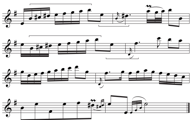
Voorbeeld 4c. Idem , een alternatief.

Ook de talrijke arpeggio's in Schmitz' uitgave, aanpassingen van akkoordgrepen die in het gamba-repertoire heel normaal zijn, passen overigens niet in de fluitstijl van de vroege achttiende eeuw; we komen hier later op terug.