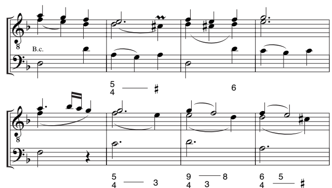
Voorbeeld 8. Marais, couplet 29.

In deze variatie vormen de twee bovenstemmen van de solist zelfs één driestemmig geheel met de basso continuo; in een uitvoering op viola da gamba zonder begeleiding komt deze variatie niet tot zijn recht. Een fluitsolo-versie is ondenkbaar.