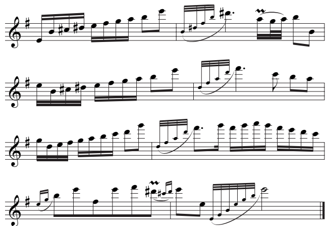
Voorbeeld 4b. Idem , Schmitz' bewerking (variantie 19).

eerste helft zijn het gebroken akkoorden) schieten vanuit het laagste register omhoog. Voor een stilistisch verantwoorde bewerking is een beperking van de omvang van de figuren zelf onvermijdelijk. Een oplossing is te vinden door de toonladder als het ware af te splitsen van langere noten die er na komen; zie voorbeeld 4c (op de eerste helft van de variatie is hetzelfde principe toepasbaar; de haken geven de splitsing van het één maat-patroon aan).