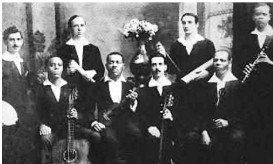
Os Oito Batutas met rechts Pixinguinha

Een interessant gegeven is het feit dat de Belgische fluitist en componist Mathieu-André Reichert (1830-