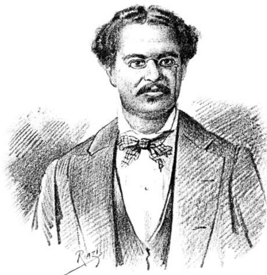
Joaquim Antonio da Silva Callado

Choro kreeg een prominente plaats in de ontwikkeling van de muzikale identiteit in Brazilië en groeide uit tot een populaire muziekstijl. In de jaren twintig liep deze muziek naadloos over in de samba, en later in de bossanova. Sommige titels zijn wereldwijd bekend geworden, zoals Tico-tico no fubá en Brasileirinho . Sinds zijn ontstaan is bijna iedere Braziliaanse componist door deze muziekvorm beïnvloed, en velen componeerden dan ook hun eigen choro's, zoals Villa-Lobos,