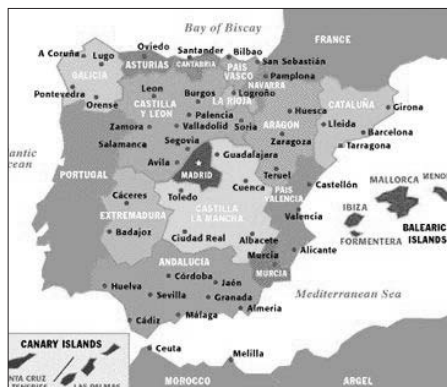
Steden van Andalucía

wordt geëvalueerd. Word je uiteindelijk geschikt verklaard, en dat is over het algemeen het geval, dan heb je een baan voor de rest van je leven in dienst van de overheid, met het voordeel dat je nooit ontslagen of wegbezuinigd kunt worden!